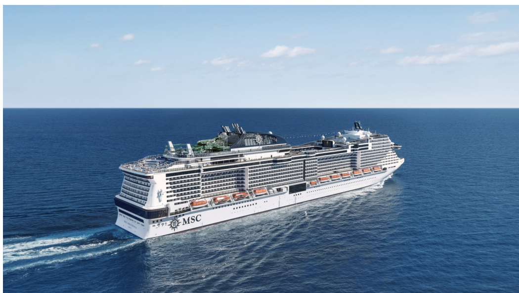
Ihr Schiff: die MSC Grandiosa

Erleben Sie das westliche Mittelmeer von seiner schönsten Seite. Von Genua über La Spezia, Civitavecchia, Palma de Mallorca, Barcelona und Cannes erwarten Sie charmante Küstenstädte, mediterranes Flair und eindrucksvolle Kulturschätze.